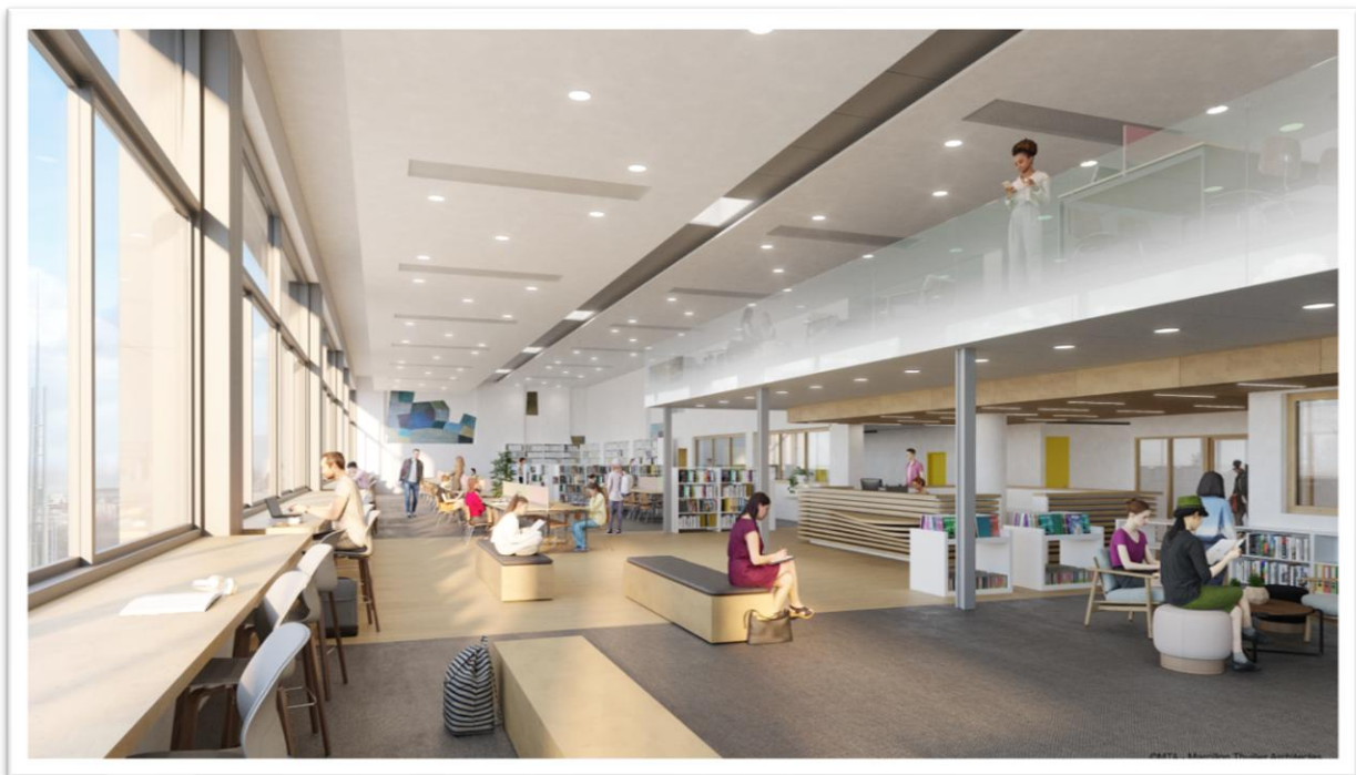
Projection d'architecte de la future BU de Droit – Marcillon-Thuilier Architectes.

Pour rappel, le Marché Global de Performance a été attribué en 2024 à l'entreprise DUMEZ Auvergne, mandataire avec le cabinet MTA Architectes, pour un montant d'un peu plus de 21 millions d'euros .