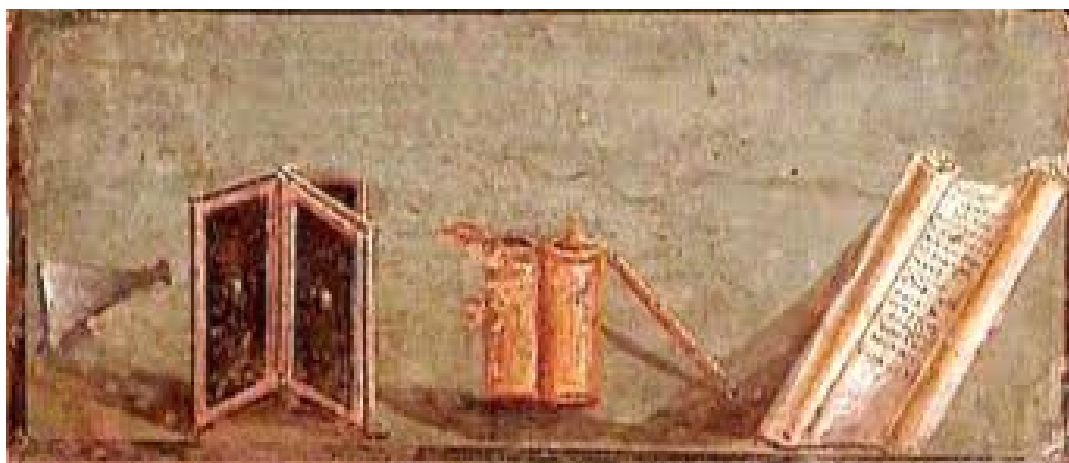
Instrumenta scriptoria , Maison de Julia Felix à Pompéi, Musée archéologique de Naples